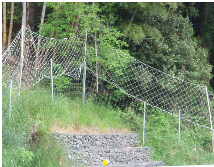
シカの飛び込みやすい斜面部分の金網柵にネット柵でかさ上げをしている。

もし、野生動物の侵入箇所や侵入しそうな箇所を見つけたら 集落柵に改良を加えたい、補強したい、工夫をしてください。 方法が分からない場合はご相談下さい。