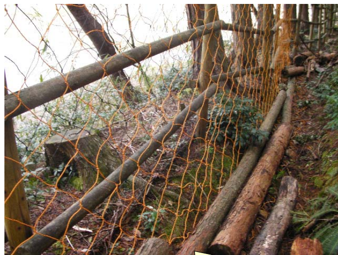
ネット柵と間伐材を利用して侵入防止効果を増強 動物が近づきにくいように工夫されている。