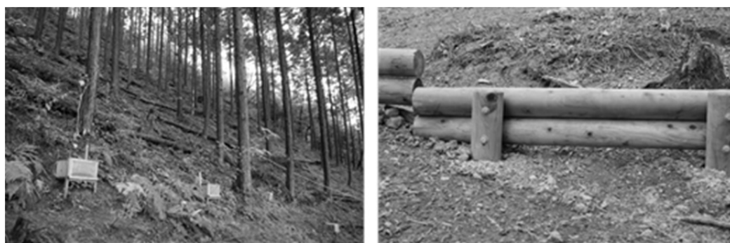
写真 7-1 間伐木を利用した筋工（左）と丸太を利用した柵工（右）

筋工、植生保護柵は、それぞれ 2009 年 3 月（養父）と 2015 年 3 月（宍粟）に実施した。また、南あわじ調査地は備長炭の原料採取を目的に皆伐した区域であり、皆伐と植生保護柵を実施した区（以下、皆伐+柵区）、皆伐と丸太を利用した柵工（写真 7-1(右)）を実施した区（皆伐+丸太柵工区）、皆伐のみを実施した区（皆伐区）、皆伐や丸太柵工、植生保護柵を実施していない区（無処理区）の 4 区とした。皆伐は 2000 年 5 月から 2003 年 4 月の間（山瀬ほか 2014）、丸太柵工と植生保護柵は 2013 年 3 月に実施した。